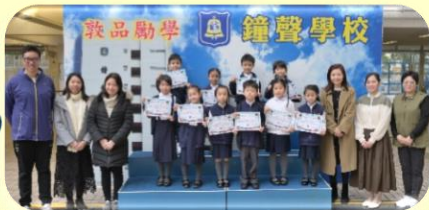
Primary 1 Winners