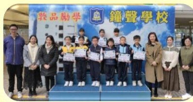
Primary 2 Winners