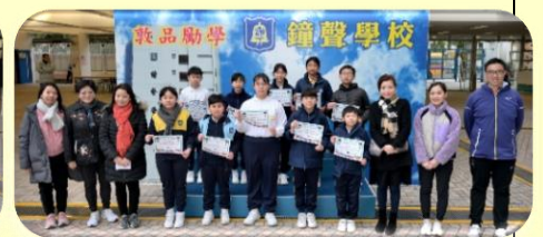
Primary 6 Winners