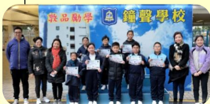
Primary 4 Winners