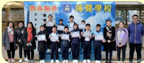
Primary 5 Winners