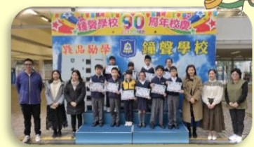
Primary 3 Winners